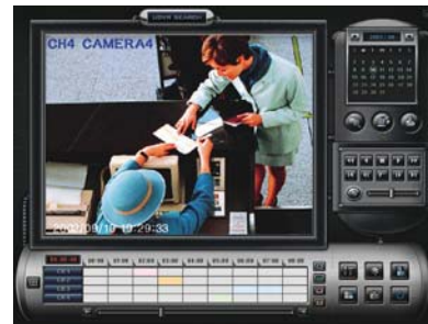
Sökning och uppspelning

Sökning kan ske efter klockslag, datum, kanal och larm.