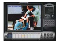
Fjärrsökning och -uppspelning