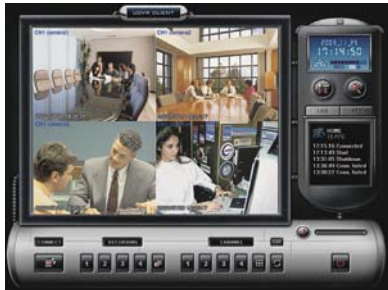
Visning och inspelning

Bilder från kameror kan visas var som helst i användarens nätverk. Övervakning, inspelning och uppspelning kan ske via TCP/IP (t ex ADSL).