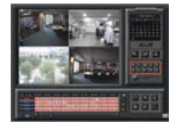
Kontroll av uppspelningshastighet