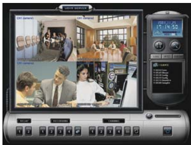
Övervakning och inspelning

MEGA4™ kan visa helbild eller fyrdelad skärm genom den inbyggda multiplexern.